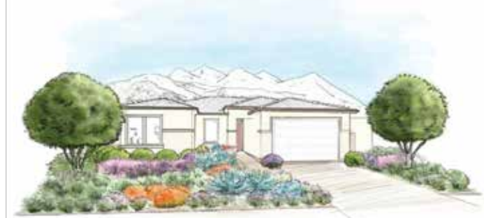
Estilo mediterráneo de poco mantenimiento