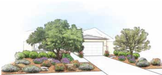
Fácil y poco mantenimiento