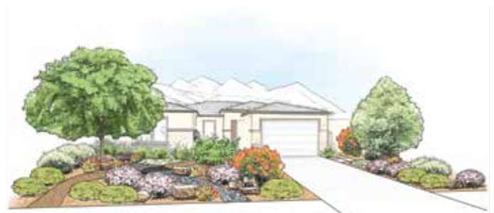
Niños, mascotas, divertido y acogedor